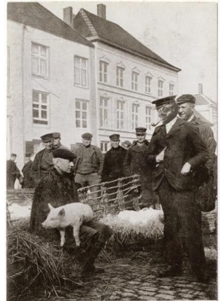
Op de vèrrekesmart (Kesteelplein meej 't 'uis Justinus van Nassau)